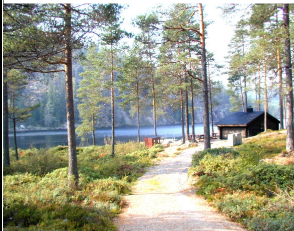
Foto från Bergtjärn

Tillbringa en varm sommarkväll i gott sällskap vid någon av de stora hyrsjöarna Bergtjärn eller Kotjärn.